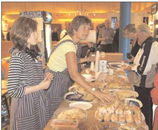
Innset Husflidslag betjener Balkongen Kafé.

På møtet ble også årets dugnadspenger delt ut. Totalt ble det lagt ned 4092 dugnadstimer, og martnan betaler i år 80,- pr. time som ga en rekordutbetaling på 327 360,- til lag og organisasjoner i Rennebu, Kvikne, Midtre