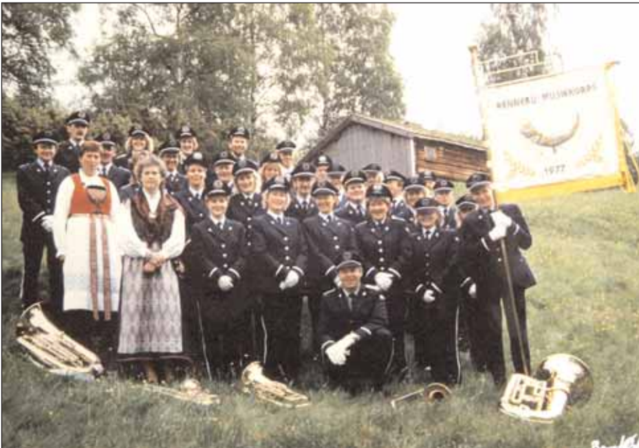
Rennebu Musikkorps - anno 1989.

Bildet er tatt under et musikkstevne på Løkken.