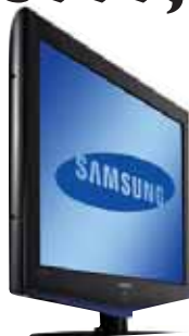
Samsung 32" LE32R72W HVIT