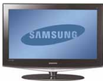
Samsung 26" LE26R72