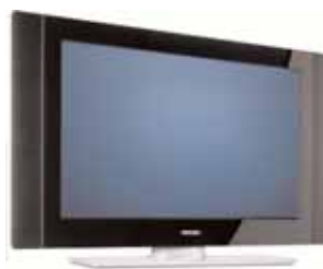
Phillips 37" 37PF733I