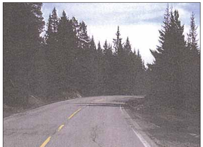
Strekning på Rv3 før arbeidet ble satt igang - og nedenfor er arbeidet nesten ferdig.