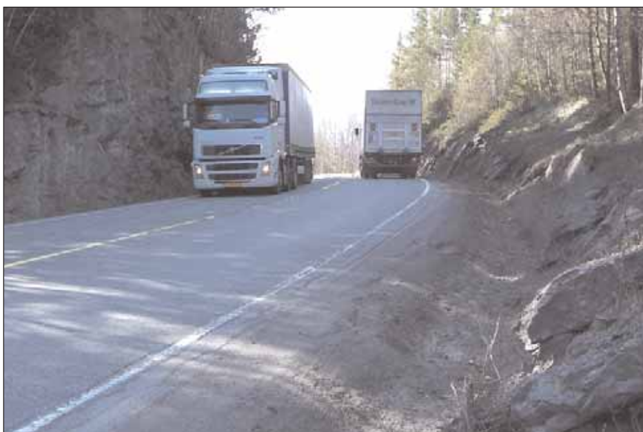
Mellom Ulsberg og Berkåk og Ulsberg og Nåverdalen skal det i sommer sprenges bort berghammere for å skape en tryggere vei.