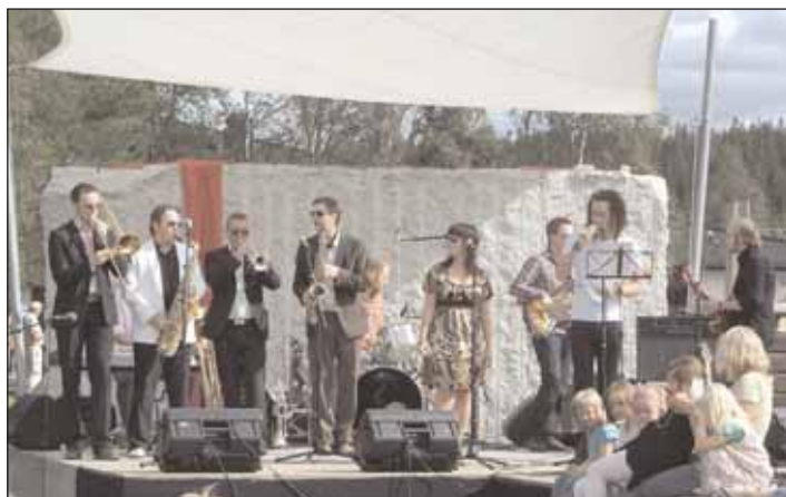
Soulmates blir «oppvarmingsband» for Alexander Rybak med FRIKAR den 9. august.

Martnaskomiteen lover å komme med flere vanvittige nyheter om årets Rennebumartna i begynnelsen av juni. Da slippes hele martnasprogrammet 2009.