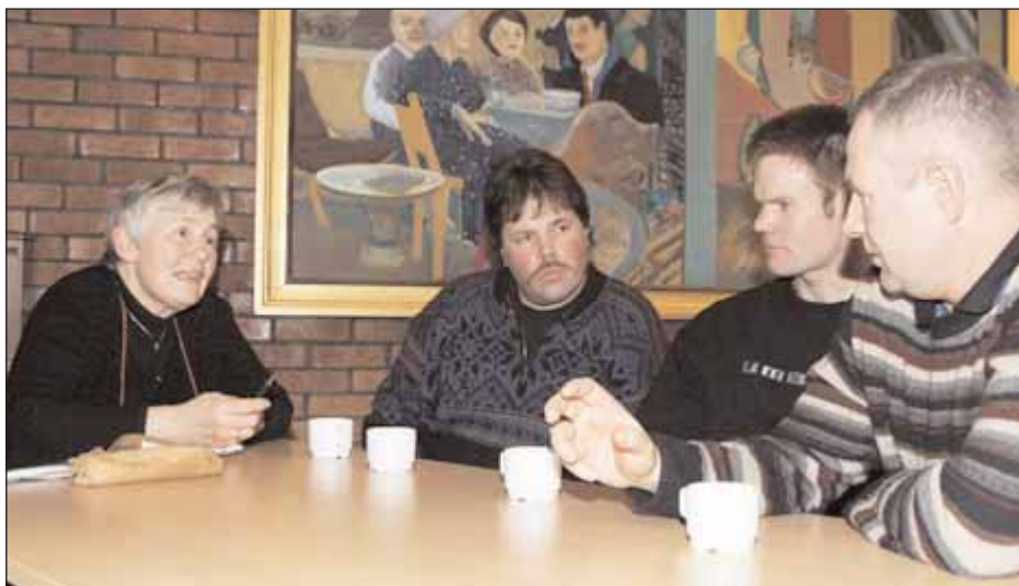
Ivrig diskusjon om kommuneplanen rundt bordene under kaffepausen.

boligeiendommer krever ikke dispensasjon. Disse områdene skal forbeholdes landbruk, og det ble reist spørsmål om hvorfor ikke Nerskogen, Havdal og Gisnåsen er med i denne sonen.