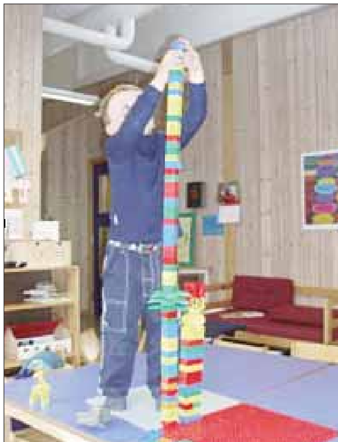
Bygging – høy-høyere-høyest.

MIO gir personalet god og viktig kunnskap om barnets matematiske utvikling. Det er en støtte for personalet til å kunne se den matematikken hvert enkelt barn har, og gjør