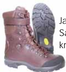
Jaktstøvel Savana kr 1998,-