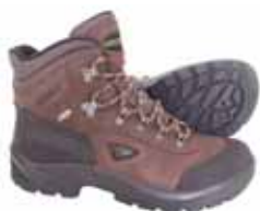
Fjellstøvel Baldo kr 849,-