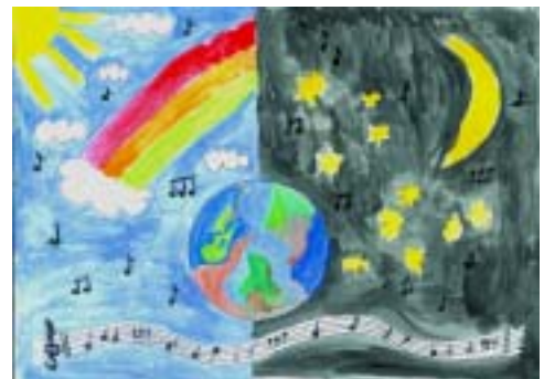
Plakaten er tegnet av Astrid Smeplass

Billetter 100,- (Barn under 15 år gratis)