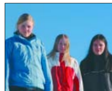
Tekst/foto: Stine Lenes