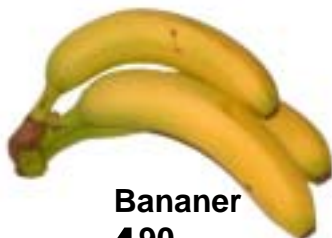
Bananer 4 90 pr kg