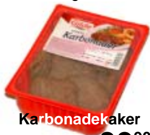
Karbonadekaker 800 gr Gilde 39 90

Torsdag 18. november inviterer vi til kaffe og bløtkake!