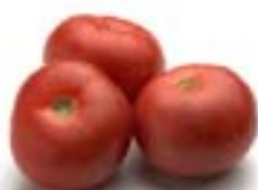
Tomater 14 90 pr kg