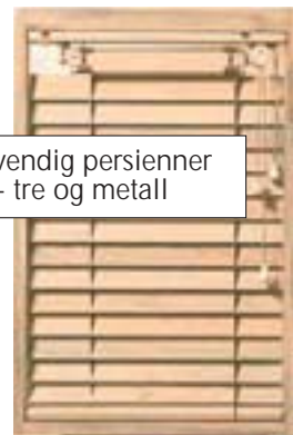
Innvendig persienner - tre og metall