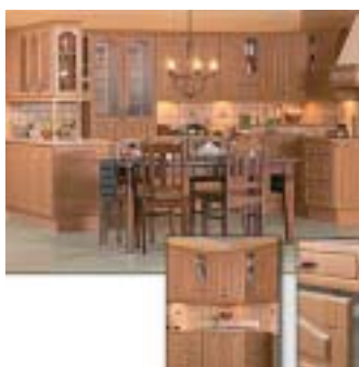
Creoform kjøkkenfornyning. Nye dører og skuffer. Vakkert og rimelig.