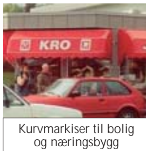
Kurvmarkiser til bolig og næringsbygg