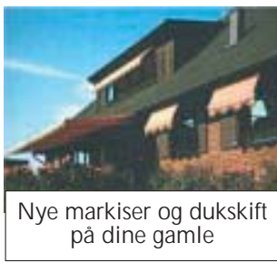
Nye markiser og dukskift på dine gamle