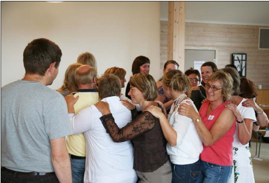
Lærere i Rennebu på kurs med emnet "Det er mitt valg", i regi av Rennebu Lions.

I Rennebu startet alle lærere og assistenter opp skoleåret 11. og 12. august med kursdager i Mjuklia ungdomssenter. Emnet var "Det er mitt valg". Kurset er utarbeidet av Lions og er på Utdanningsdirektoratets topp ti liste over forebyggende arbeid.