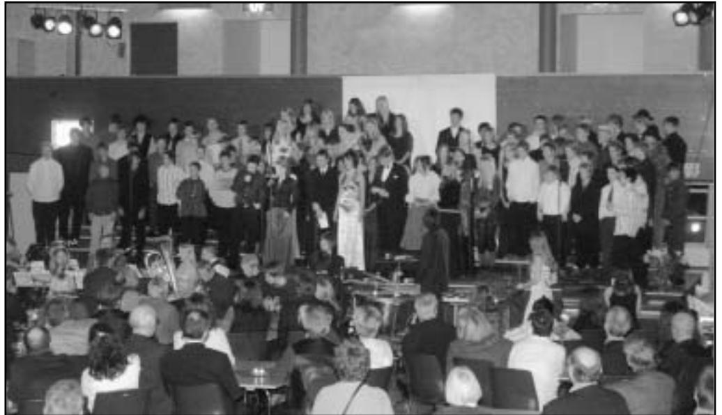
Den ble en vellykket og opplevelsesrik innvielsesfest, og alle elever ved ungdomsskolen avsluttet med fellessang til stående applaus fra publikum.

Nyskolen ble finansiert med den gunstige statlige finansieringa, ordninga som ble opprettet da Trond Giske var undervisningsminister. Det var derfor naturlig å invitere Giske til å stå for selve åpninga av nybygget. Giske sa i sin tale at rennbyggene var veldig kjappe (i vendingen) til å søke om sin andel av de 15 rentefrie milliardene som var bevilget til nybygg av skoler. - De 9,4 millionene Rennebu fikk har ført til at