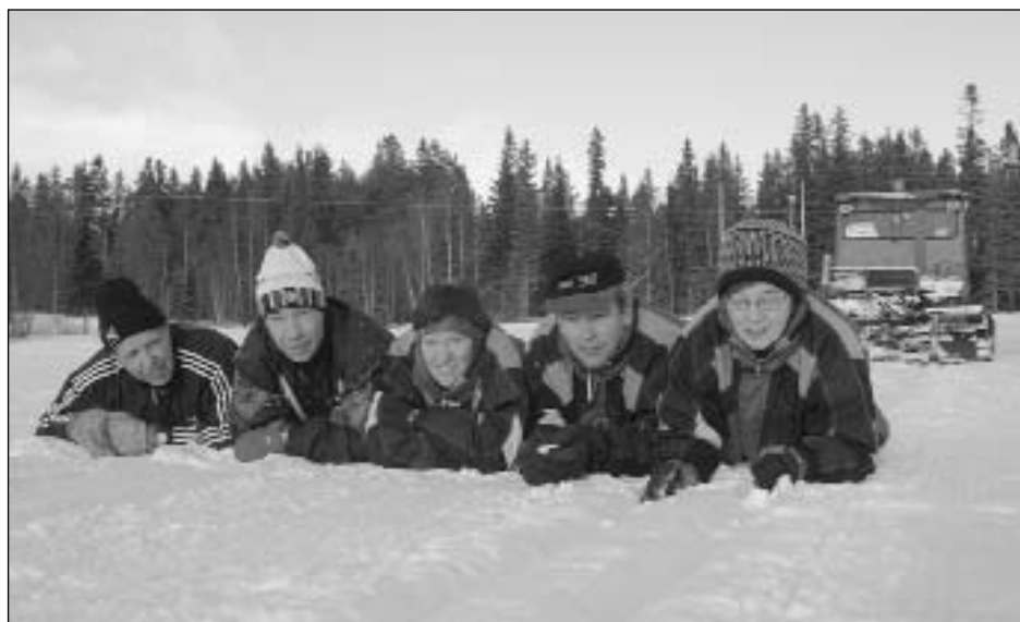
NM-komiteen har løypene klare til de vel 100 veteranene som er påmeldt.

I dagene 6. til 8. februar arrangerer Rennebu il årets Veteranmesterskap i langrenn.