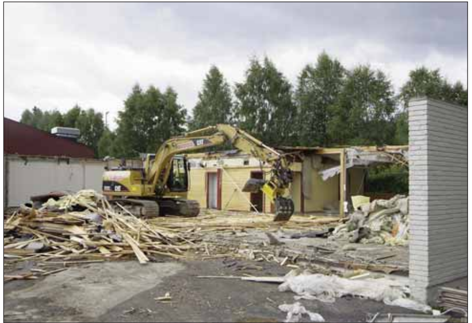
Rivningsarbeidet gikk raskt unna da det gamle lærerværelset ved Berkåk skole skulle jevnes med jorda.

Rivningsarbeidet ble satt i gang så smått ved skoleslutt i vår, og hele bygget skal være jevnet med jorda til Rennebumartnan. Arealet skal så brukes under martnaen før forberedelsene for bygging settes igang på høsten. Prosjektet har en kostnadsramme på 27 millioner og forhåpentligvis er nybygget innflyttingsklart ved skolestart høsten 2010.