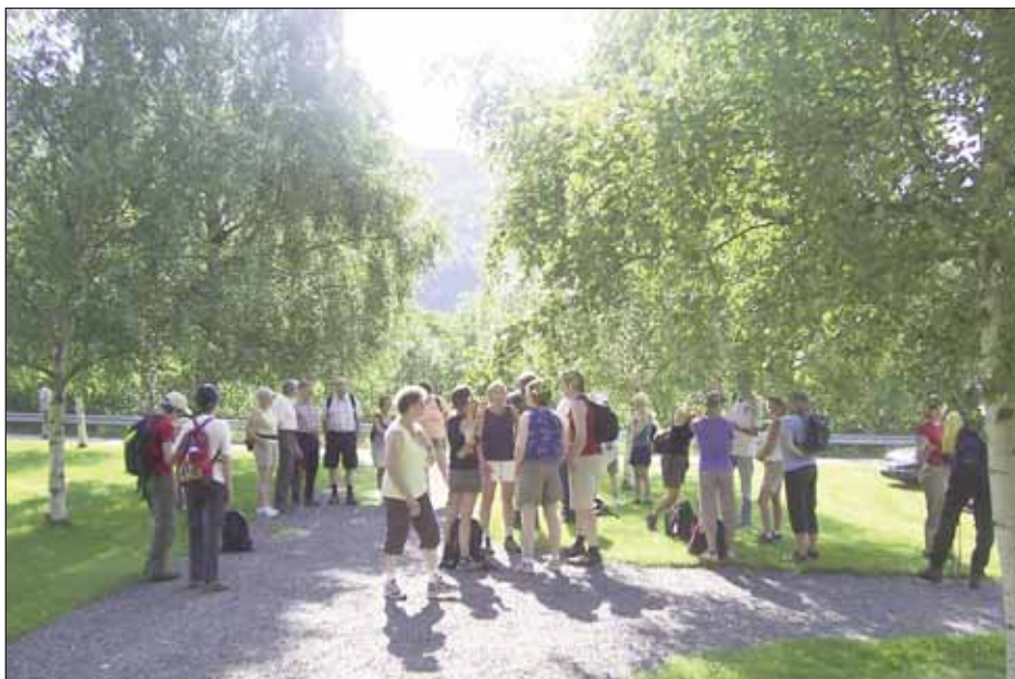
Omlag 30 ivrige pilegrimer gjør seg klare til marsjen ved Rennebu Kirke på Voll.

Vegkantene er nå prydet med hele spekteret av markblomster i alle regnbuens nyanser. Men, det er trist å se på heggen som for en måned siden sto i frodig blomsterflor, nå er det mest grå