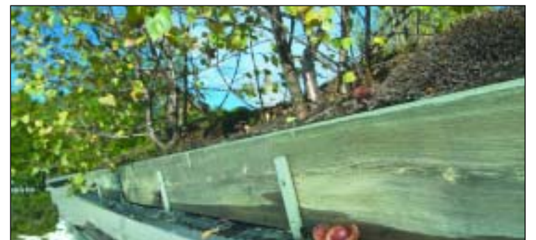
Trær på torvtaket bør fjernes for å unngå lekkasjer.

Torvtak trenger også vedlikehold, og som med annet vedlikehold er det viktig å være på forskudd. Sørsiden av bratte tak er ofte utsatt for tørke, og da kan det være aktuelt å vanne slik at