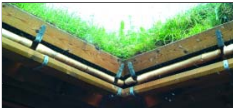
Eksempel på godt vedlikeholdt torvtak.

— Å tekke husa med torv er en gammel metode, og torvtak kan være med på å gi bygget et tradisjonelt preg. Torvtaket har flere egenskaper. Tidligere ble isolasjonsegenskapene satt pris på. Det er ikke så viktig i dag da man har andre og bedre materialer å isolere med. Men torvtaket har stor varmekapasitet og er med på å utjevne temperaturen inne i huset. Et torvtak gir også god beskyttelse mot støy og kan med fordel brukes på steder hvor det er et problem. På