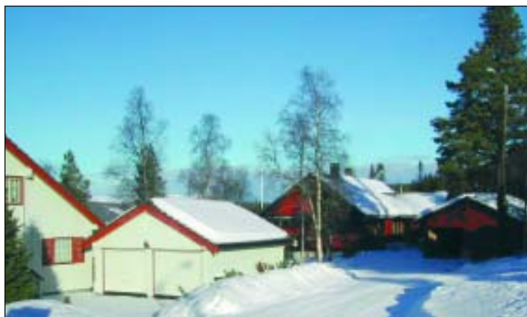
Hus i boligfelt på Berkåk, som står godt til hverandre i takform, farger og volum.