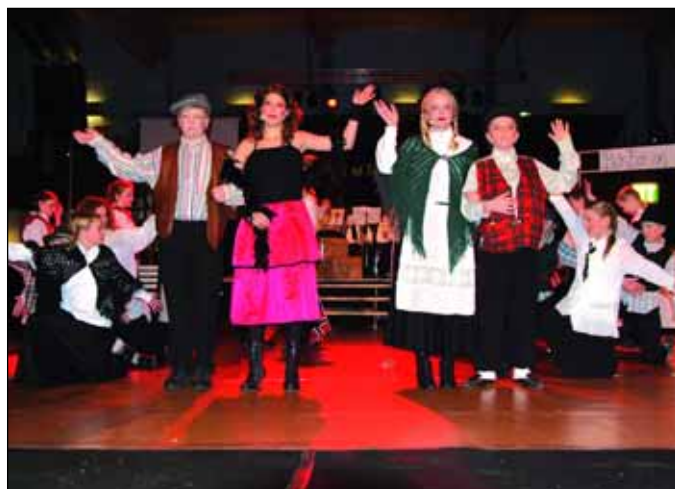
Soknedal skolekorps under fjorårets RennebuSpæll.

Av arrangement som allerede er i boks kan vi nevne RennebuSpæll lørdag 25. oktober, ungdomsskolens årlige musicaloppsetning torsdag 30. og fredag 31. oktober, og vi regner det vel også som ganske sikkert at det blir "orgelkveld" i Berkåk Kirke søndag 2. november. Ellers så kom det frem på møtet at der er konkrete ideer om en fotoutstilling, håp om en operaforestilling, en mulig kunstutstilling med nasjonal kunstner, og at Kulturskolen som vanlig vil engasjere seg. På møtet