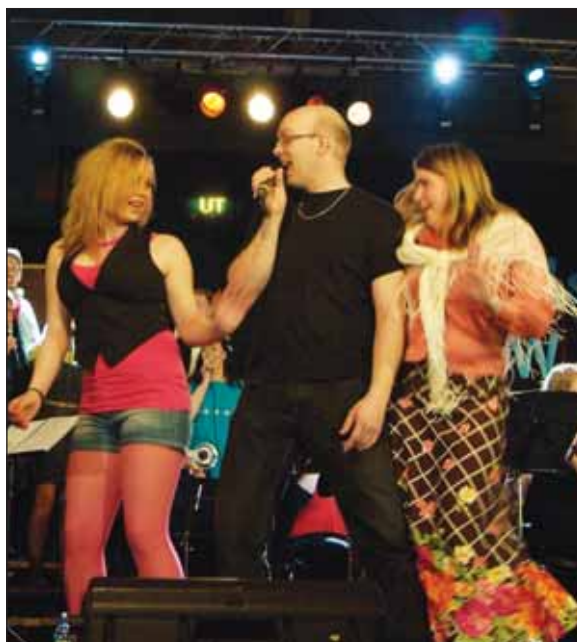
Bildet er fra fjorårets prosjekt med Rennebu Musikkorps.

Bergsrønning forteller videre at det vil bli satt opp to forestillinger av årets Musical-prosjekt. Lørdag 14. mars er det premiere i Kulturhuset på Oppdal, og søndag 15. mars er det klart for