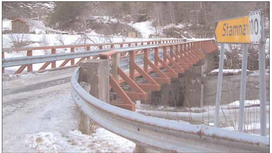
Rehabilitering av Stamnesbrua kan være et aktuelt tiltak.

Tiltakspengene fordeles etter kommunenes innbyggertall, og hvis pakken