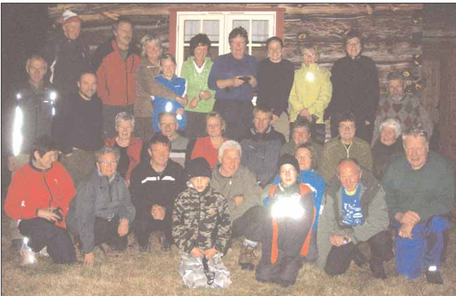
Alle måneskinnsvandrerne samlet ute ved Herremssetra.

Fullmånen lyste over Skru'n denne oktoberkvelden - et flott syn, og en spesiell måne som var historisk nær vår egen klode akkurat denne månefasen.