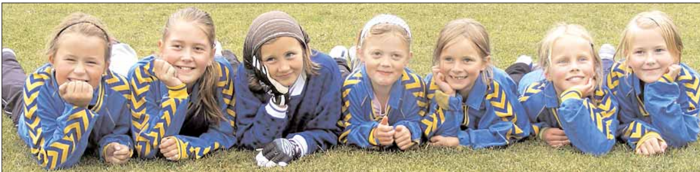
Barn og unge er Rennebus framtid!

Utvalget skal legge fram forslag til tiltak for formannskapet og kommunestyret, som i neste omgang avgjør hvilke tiltak som skal gjennomføres, og samtidig vedtar nødvendig finansiering.