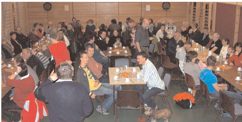
Fredag 20. oktober arrangerte Gisnås og Havdal Grendalag en velkomstmarkering ved Havdal skole for å vise at de setter pris på alle som har flyttet til grenda det siste året.

I løpet av det siste året har det flyttet tre familier til grenda, en familie i Gisnadalen, en i gamle Havdal skole og en i nye Havdal skole, til sammen 16 personer. Disse ble ønsket velkommen av Gisnås og Havdal Grendalag med kveldsmat for alle i grenda ved Gjesteheim og møtested Havdal skole fredag kveld.