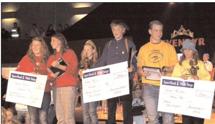
Melhus/Utleira Skolekorps (i midten) vant årets Rennebu Spøll, med Strand skolekorps (t.h.) på andre og Vikhammer og Saksvik Skolekorps (t.v.) på tredjeplass.